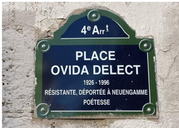
« Place Ovida Delect », Paris, 2025