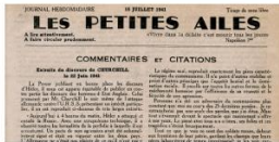
16 juillet 1941, ProvenanceBnF, Réserve des livres rares, RES-G-1470(273)

Elle utilise ses compétences de secrétaire pour élaborer la page régional du journal « les petites ailes de France », elle participe à sa diffusion en Normandie.