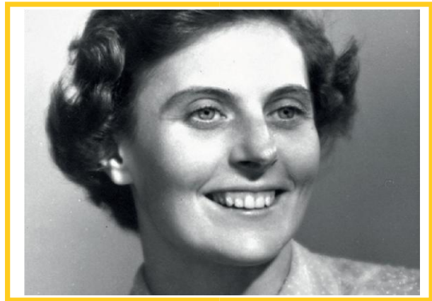
Cécile DeWitt-Morette

Cécile DeWitt-Morette est née le 21 décembre 1922 à Paris. Elle a vécu son enfance à Caen. Elle voulait faire des études de médecine, mais sa mère l'orienté vers les mathématiques. Pendant la guerre (en 1943), elle monte à Paris pour des études de physique quantique. Le 6 juin 1944, elle prend le train pour aller passer ses examens. Caen se fait bombarder et sa mère, sa grand-mère et sa sœur meurent. Ensuite elle continue sa formation en assistant Frédéric Joliot-Curie, puis elle va à Dublin, à Copenhague et enfin à Princeton où elle rencontre son futur mari, Bryce DeWitt.